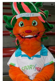
Sporty, Sportpromotor gemeente Groningen

Wat is fijner als kind dan heerlijk je energie kwijt kunnen, terwijl je op een sportieve manier vrienden maakt? In Groningen, Haren en Ten Boer werken we met vele partijen samen om sport meer toegankelijk te maken voor kinderen tot 15 jaar. Onder de vlag van Bslim zetten de samenwerkende partijen kids in beweging en brengen ze alle initiatieven bij elkaar tot een mooi en uitdagend bewegingsaanbod. We willen zoveel mogelijk kinderen en hun ouders bereiken. Daarom is het goed om herkenbaar te zijn. Vandaar deze richtlijnen “Communicatie vanuit of over Bslim.”